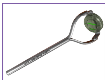
Croix de Berthold