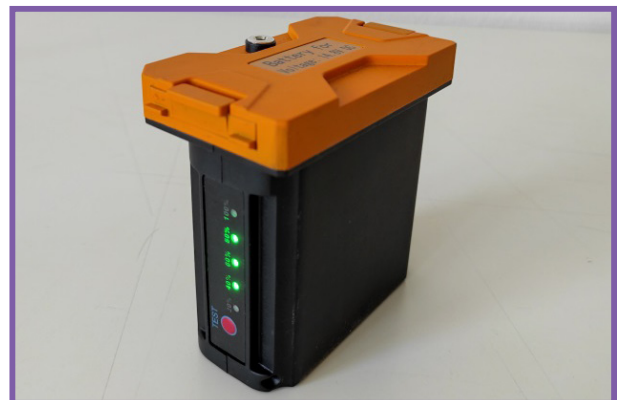
Batterie de recharge