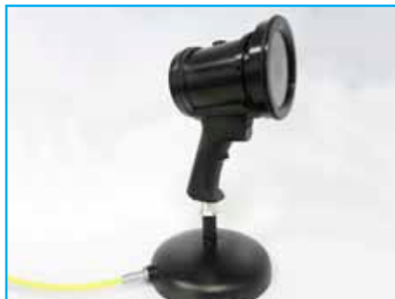
Socle pour recharge (31STACH365)

Ceinture réglable discrète et légère pour encore plus de confort, permet d'accrocher fermement le modèle sur batterie sans risque de chute grâce au système de sécurité tout en laissant une totale liberté de mouvement à l'inspecteur.