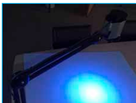
Spot sur bras articulé

Vous ne savez pas où poser votre projecteur ? Nous avons la solution pour le suspendre et le fixer afin qu'il reste à portée de main.