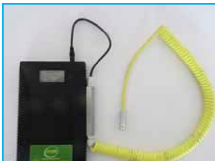
Batterie externe (31PBATEX365)

Robuste et légère, permet le rangement et le transport de l'équipement en toute sécurité.