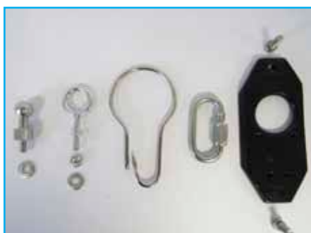
Kit de fixation universel (31KITAC365)

Permet de maintenir le projecteur en poste de travail fixe avec accrochage et décrochage rapides.