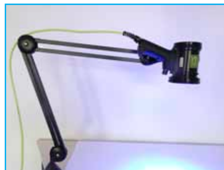
Bras articulé + bride de fixation (31BRAART365)

Permet de fixer un appareil photo sur le dessus de la coque de l'appareil lors d'expertises nécessitant une documentation.