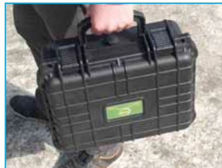
Mallette de transport (31VALED365)

Permet de poser et de charger la batterie interne en connectant simplement le projecteur à la borne de l'embase branchée sur le secteur (temps de rechargement complet « à vide » : 4h).