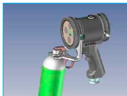
Support aérosol (31SUPAER365)

Projecteur en version spot sans poignée avec bras articulé pour poste fixe (performances identiques aux projecteurs S-LED, fonctionnement non temporisé).