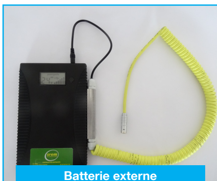
Batterie externe (31PBATEX365)

Robuste et légère, permet le rangement et le transport de l'équipement en toute sécurité.