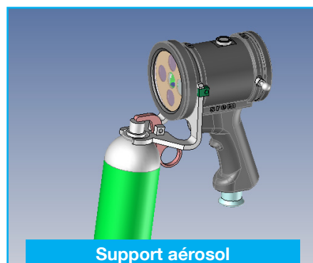
Support aérosol (31SUPAER365)

Projecteur en version spot sans poignée avec bras articulé pour poste fixe (performances identiques aux projecteurs S-LED, fonctionnement non temporisé).