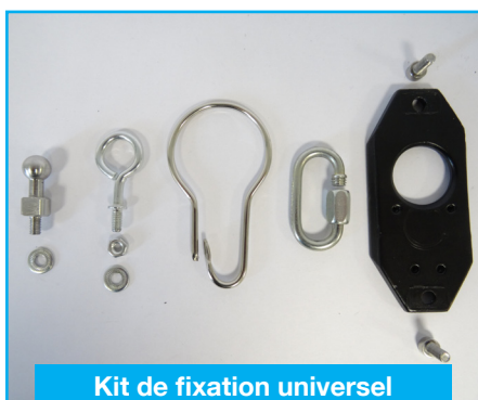
Kit de fixation universel (31KITAC365)

Permet de maintenir le projecteur en poste de travail fixe avec accrochage et décrochage rapides.