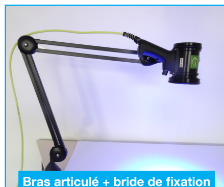
Bras articulé + bride de fixation (31BRAART365)

Permet de fixer un appareil photo sur le dessus de la coque de l'appareil lors d'expertises nécessitant une documentation.