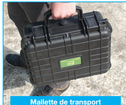
Mallette de transport (31VALED365)

Permet de poser et de charger la batterie interne en connectant simplement le projecteur à la borne de l'embase branchée sur le secteur (temps de rechargement complet « à vide » : 4h).