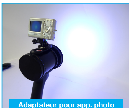
Adaptateur pour app. photo (31SUPVID365)

Ultra plate et légère, pour davantage d'autonomie, jusqu'à 8h en fonctionnement continu.