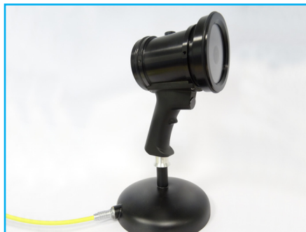
Socle pour recharge (31STACH365)

Ceinture réglable discrète et légère pour encore plus de confort, permet d'accrocher fermement le modèle sur batterie sans risque de chute grâce au système de sécurité tout en laissant une totale liberté de mouvement à l'inspecteur.